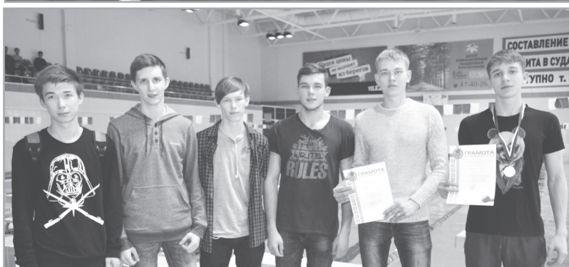
Материал предоставлен руководителем физвоспитания Т. А. Кругликовой

УКАЗ Президента России № 76 от 25 января 2005 года «О Дне российского студенчества» официально утвердил «профессиональный» праздник российских студентов. Так случилось, что именно в Татьянин день, который по новому стилю отмечается 25 января, в 1755 году императрица Елизавета Петровна подписала указ «Об учреждении Московского университета», и Татьянин день стал официальным университетским днем, в те времена он назывался Днем основания Московского университета. С тех пор Святая Татиана считается покровительницей студентов. Кстати, само древнее имя «Татиана» в переводе с греческого означает «устроительница».