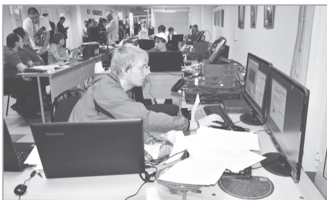
Компетенция «Сетевое и системное администрирование»

Республика Мордовия Нижегородская область Республика Башкортостан Оренбургская область Республика Татарстан Пензенская область Удмуртская Республика Самарская область Чувашская Республика Саратовская область Кировская область Ульяновская область